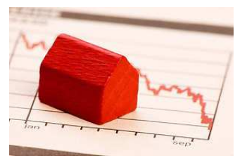
Croissance à trois chiffres des résultats

La croissance des bénéfices : un maître mot pour toute entreprise qui tente l'aventure boursière. Une exigence perpétuelle pour les investisseurs à la recherche de visibilité qui n'aiment pas être déçus. C'est dire si ces dernières années ont été difficiles pour de nombreuses sociétés, frappées par la crise économique ou encore l'évolution des technologies et des habitudes des consommateurs.